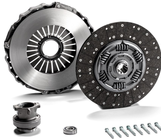
Оригинальные детали сцепления от 2,5 тыс. руб.