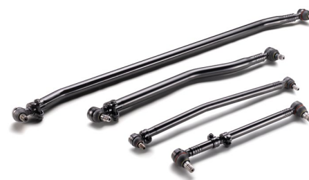
Оригинальные рулевые тяги MAN от 10 тыс. руб.