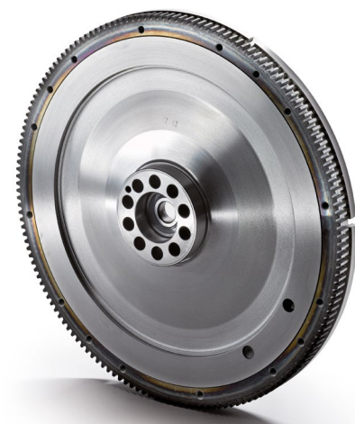
Оригинальные маховики MAN от 80 тыс. руб.