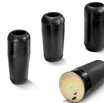
Оригинальные Пневмобаллоны MAN от 7 тыс. руб.