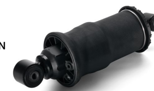
Оригинальные амортизаторы кабины MAN от 13 тыс. руб.