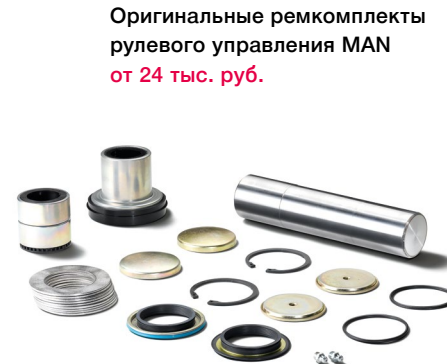
Оригинальные ремкомплекты рулевого управления MAN от 24 тыс. руб.