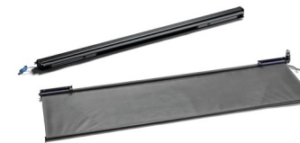
Оригинальные противосолнечные шторы MAN от 10 тыс. руб.