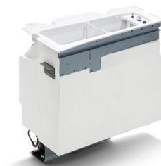
Оригинальный холодильный шкаф от 78 тыс. руб.