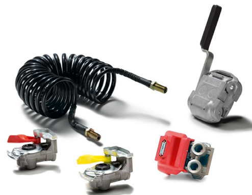
Оригинальные запчасти MAN для присоединения прицепа от 6 тыс. руб.