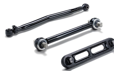
Оригинальные продольные рычаги MAN от 16 тыс. руб.