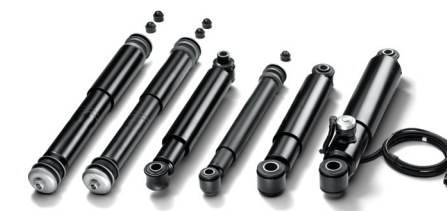
Оригинальные амортизаторы подвески MAN от 13 тыс. руб.