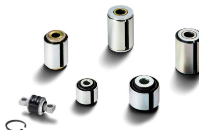
Оригинальные компоненты осей MAN от 3,5 тыс. руб.